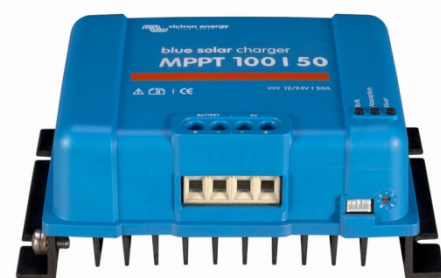
Contrôleur de charge solaire MPPT 100/50