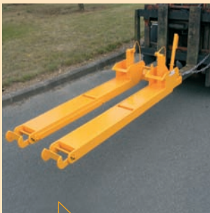
Montage rapide sur fourches