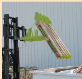
Vidage intégral et palette maintenue