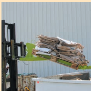
Déchargement sans effort !