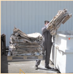
Avant : déchargement fastidieux à la main