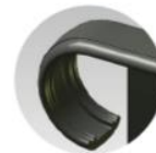
droite et/ou gauche