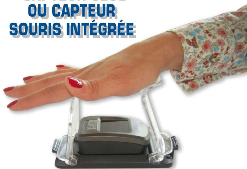
Situation : capteur VeinSecure avec socle d'enrôlement