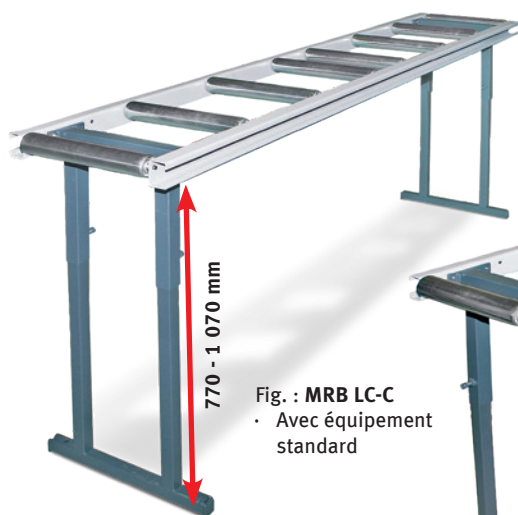
Fig. : MRB LC-C • Avec équipement standard