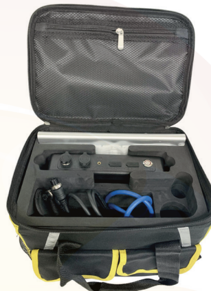
Sac de rangement (caméra, câbles, écran, clavier)