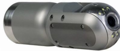
Caméra pan 360° X tilt 180° 6 LEDs d'éclairage