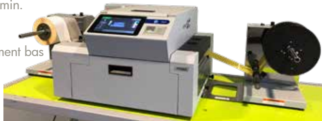
Astro L1 avec enrouleur et dérouleur (en option)

Mais la L1 offre maintenant encore plus de possibilités: