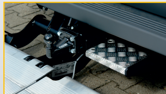
Option : marchepied et console attache-remorque Montage rapide et facile, y compris après la pose du hayon.