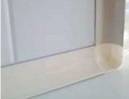
Cloisons de séparation

PANNEAU D'ÉPAISSEUR STANDARD 70MM POUR VERSION POSITIVE ET 100MM POUR VERSION NÉGATIVE