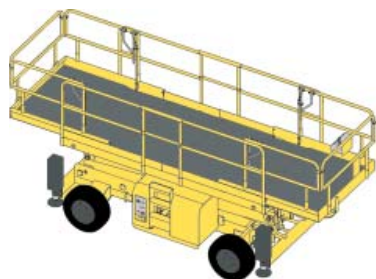
Plate-forme automotrice à ciseaux – 15 m – 4 x 4 – tout-terrain → Haulotte H15 SX