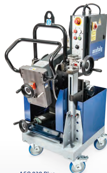
ASO 930 Plus