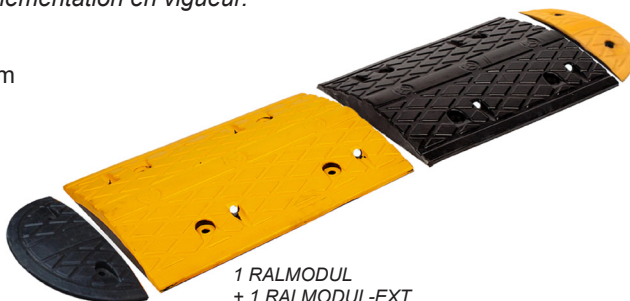
1 RALMODUL + 1 RALMODUL-EXT