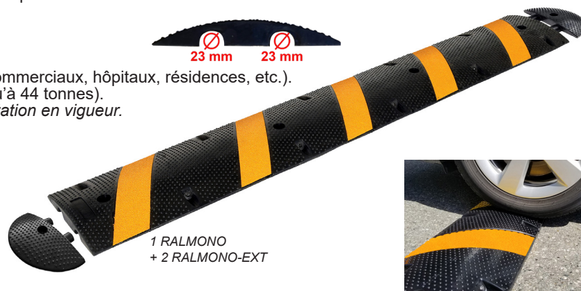
1 RALMONO + 2 RALMONO-EXT