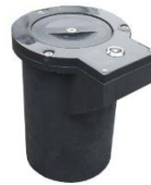
Option : base à sceller TPBOX100