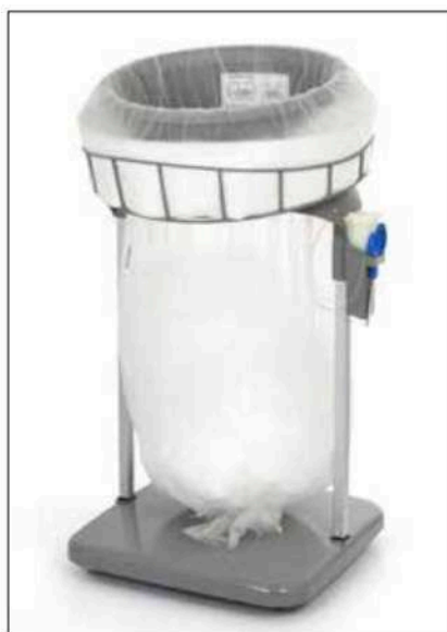
Stand Classic Maxi/Maxi Food