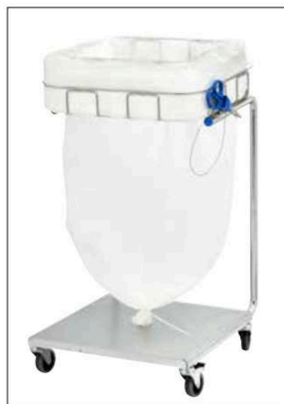
Stand Dynamic Maxi/Maxi Pedal