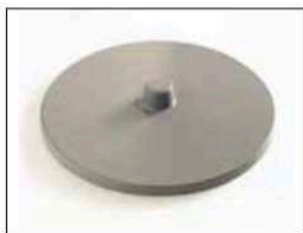
Couvercle pour Longopac Stand Classic Maxi et Mini Mini. Item no 31140 Maxi. N° d'art. 30140