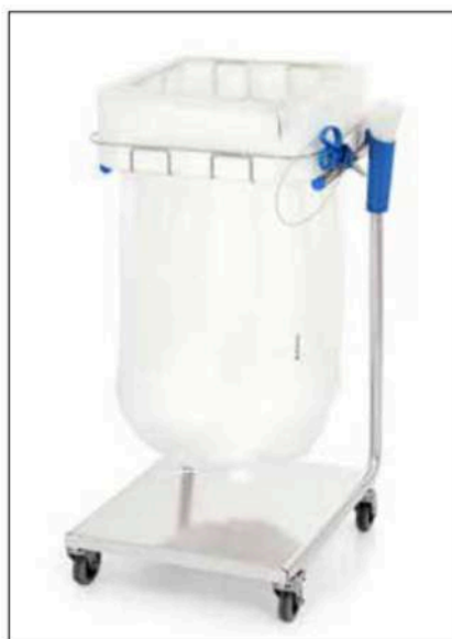
Stand Dynamic Midi/Midi Pedal