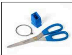
Kit de ciseaux pour Longopac Stand Dynamic, à métal détectable Item no. 34609 Kit contenant des ciseaux à métal détectable, un support de ciseaux et un câble inoxydable.