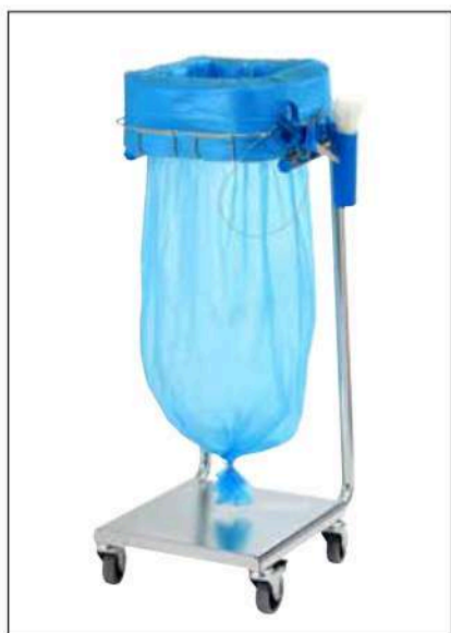
Stand Dynamic Mini/Mini Pedal