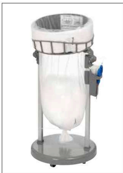
Stand Classic Mini/Mini Food