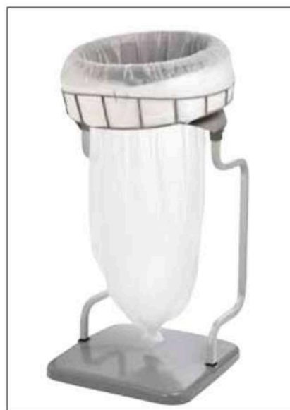
Stand Classic Recycling