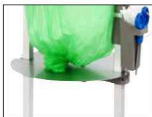
Plaque réglable pour Stand Classic Mini Item no. 31480 Réduit la consommation de matériau de sac ainsi que la taille du sac. Conçue en premier lieu pour les déchets poisseux et lourds. Peut être utilisée avec les cassettes de sacs Bio.