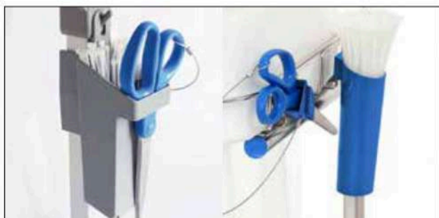
Support d'attaches de câble pour Longopac Stand Classic Standard, gris. N° d'art. 30410 À métal détectable, bleu Item no. 30416 Le support d'attaches de câble permet de remplacer les sacs encore plus rapidement et maintient les attaches en place. Convient à Maxi et Mini et est disponible en deux modèles.