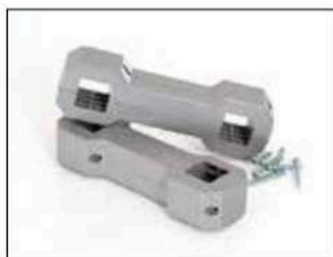
Connecteur de supports pour Longopac Stand Classic Item no. 33750 Pour connecter simplement et solidement deux Longopac Stand ou plus. Il est également possible de connecter Maxi à Mini.