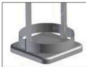
Cadre pour Longopac Stand Classic Maxi Item no. 33900 Le cadre maintient le sac en place.