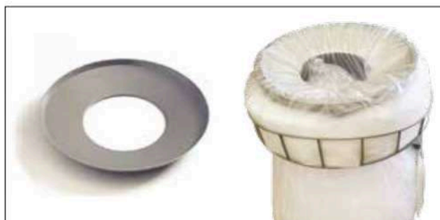
Disque perforé pour Longopac Stand Classic Maxi Item no. 30170 Réduit l'orifice de dépôt, ce qui simplifie la compression du plastique recyclé, par exemple. Uniquement disponible pour Maxi.