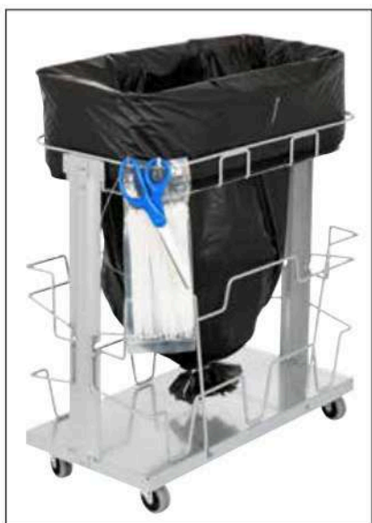
Stand Dynamic UBS