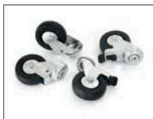
Kit de roulettes, pour Longopac Stand Dynamic, Item no. 34616 Contient quatre roulettes, deux d'entre eux avec des freins. Remplace les roues d'origine sur les stands utilisés dans les zones à accès restreint ESD.