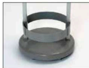
Cadre pour Longopac Stand Classic Mini Item no. 33890 Le cadre maintient le sac en place.