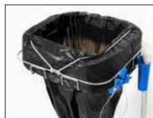
Élastique Item no. 3102 Cet accessoire peut être utilisé pour tous les supports de cassettes Longopac. Verrouille efficacement la cassette et empêche la cassette de se déployer.