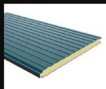
Panneau micro nervuré