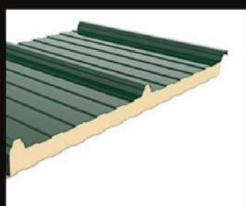
Panneau sandwich TOITURE