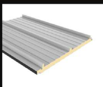
Bac acier isolé