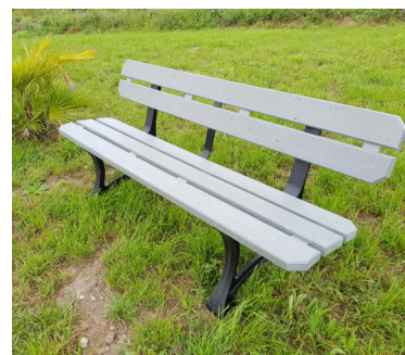
Réf. : BCU