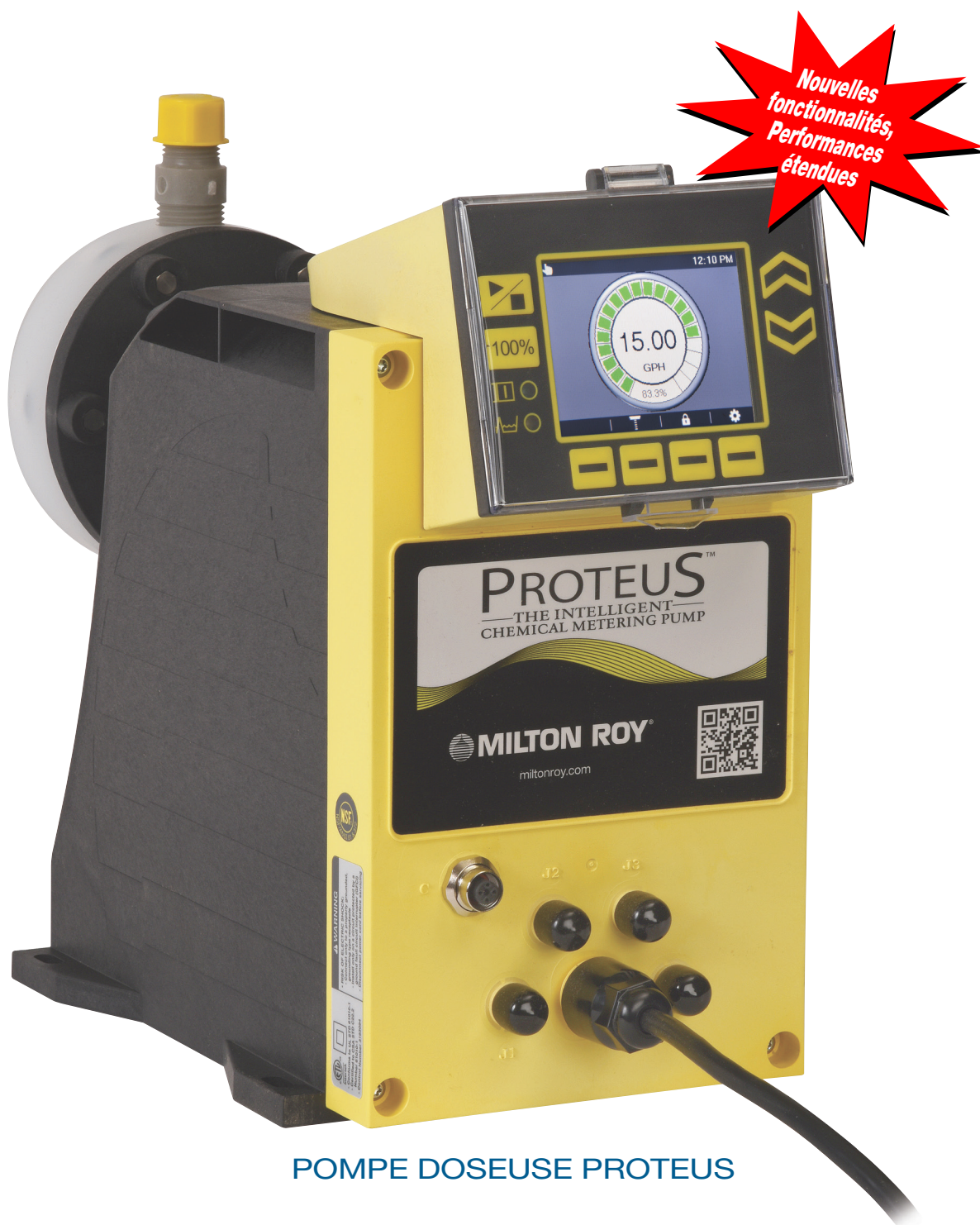
POMPE DOSEUSE PROTEUS