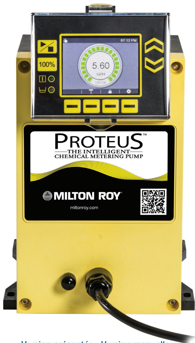
Version présentée : Version manuelle

Le choix de votre pompe n'a jamais été aussi facile. Nul besoin de configurations compliquées pour trouver la pompe parfaite pour votre application. Avec les versions Manuelle, Enrichie et Communication, choisissez simplement les caractéristiques qui correspondent à vos besoins (liste complète en page 6). Ces modèles offrent un large éventail de fonctionnalités, avec entre autres un écran rétroéclairé, plusieurs langues de navigation et la communication bidirectionnelle.