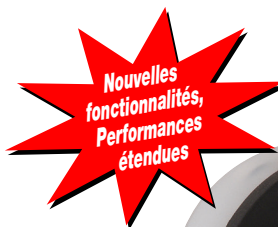
Plate-forme technologique universelle

Un dosage optimum à chaque course : quel que soit le fluide, quel que soit le débit