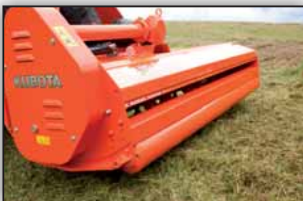
Rouleau arrière Ø 160 mm avec barre décrottoir réglable (équipement standard).