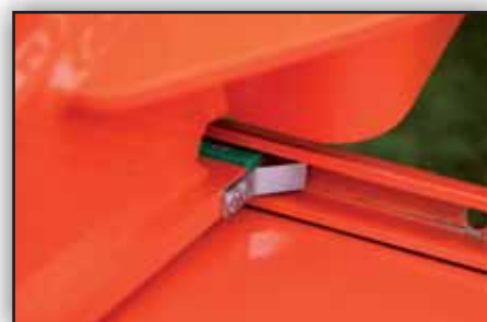
Guides spéciaux en nylon montés sur des glissières afin de permettre un déplacement sans lubrification spécifique.