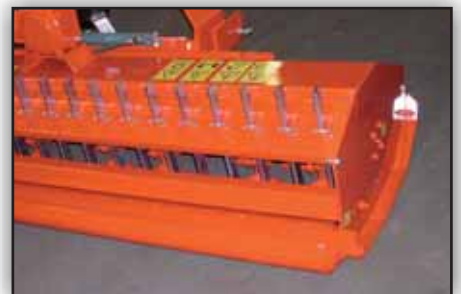
Le SE3000 peut recevoir en option des peignes à sarments afin d'améliorer le broyage.