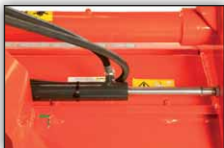
Déport latéral hydraulique de 500mm