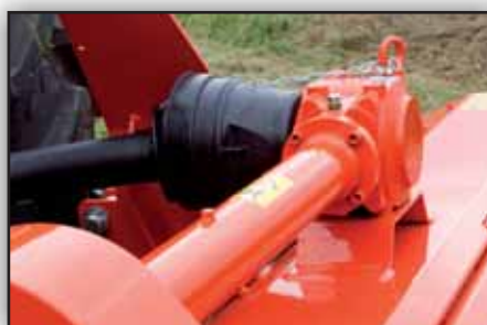
Boîtier pour tracteur jusqu'à 80 CV - Prise de force 540 tr/min - Roue libre intégrée en standard.