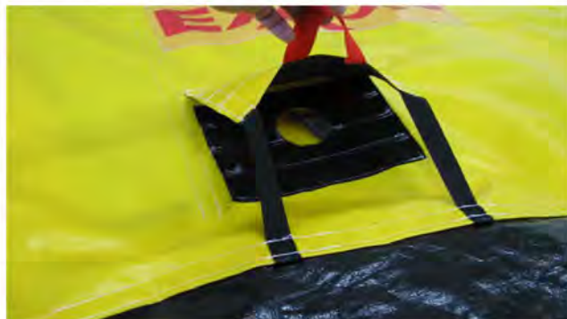
Notre modèle standard