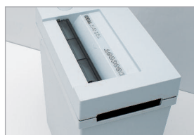
Poignées pour retirer facilement le mécanisme du réceptacle

Conforme aux normes de sécurité européennes.