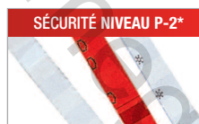
Modèle C/F - 4 mm Pour les documents internes.