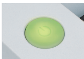
Interrupteur EASY-TOUCH avec témoin lumineux intégré