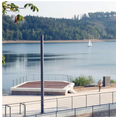
Sorpetalsperre Uferpromenade DE - Sundern