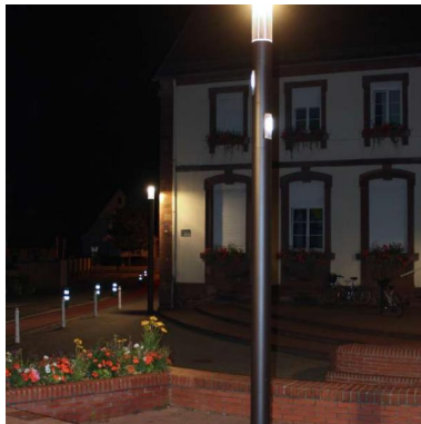
Kirchplatz Drusenheim FR - Drusenheim