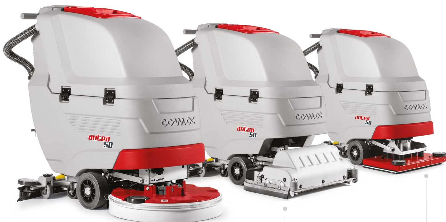
ANTEA 50 E/B/BT