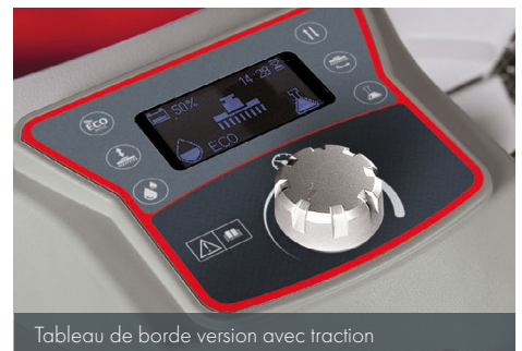
Tableau de bord version avec traction

Les versions sans traction (Antea 50 E/B) sont équipées avec un panneau de commande essentiel qui favorise une utilisation immédiate. Les versions à traction se distinguent par l'équipement de certaines fonctions supplémentaires, telles que le dispositif Eco pour la réduction des consommations et le bouton rotatif pour le réglage de la vitesse.