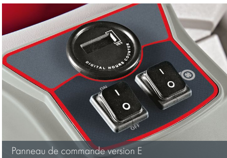
Panneau de commande version E