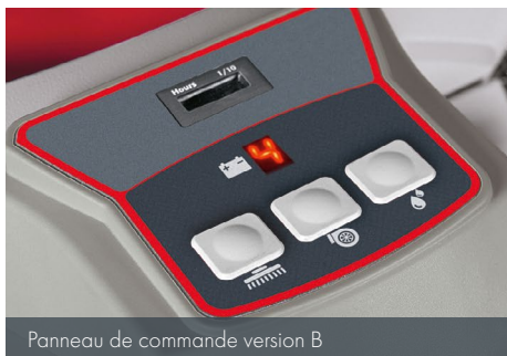
Panneau de commande version B