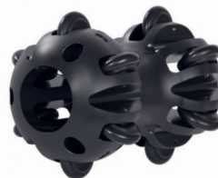
PIC 6.0 - 145 Centreur à roulettes (Ø > 150mm)