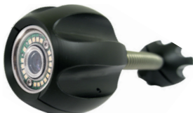
PIC 6.0 - 210 Centreur / protection (Ø 100mm)