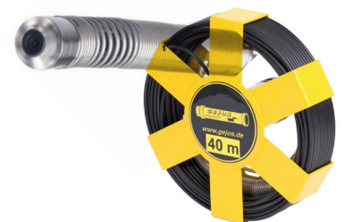
PIC 6.0 - 812 Enrouleur complémentaire de 40m (Ø 3,4mm) avec tête de caméra PIC 1.9 de 19mm (en acier inoxydable)