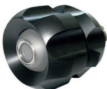
PIC 6.0 - 230 Centreur / protection (Ø 70mm)