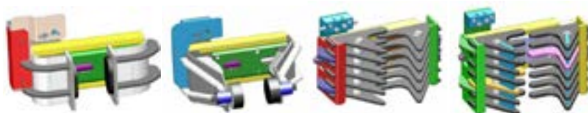
POUR PIEUX BÉTON