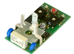
Composants PCB de haute qualité

JORC est certifié NEN - EN - ISO 9001:2015