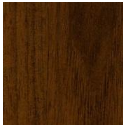
Noyer des plaines