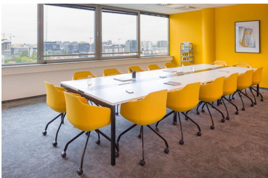
Table composée de 3 modules L140 x P141 cm (1 DEPART + 2 SUIVANT). Dimensions 420 x 141 cm, pour 16 personnes.

DÉLAI DE LIVRAISON INDICATIF : 3-4 semaines