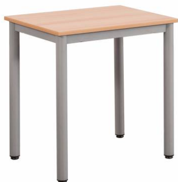
Table scolaire multifonction