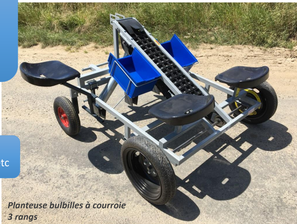
Planteuse bulbilles à courroie 3 rangs

Exemples d'utilisation: oignons, échalotes, fèves, etc