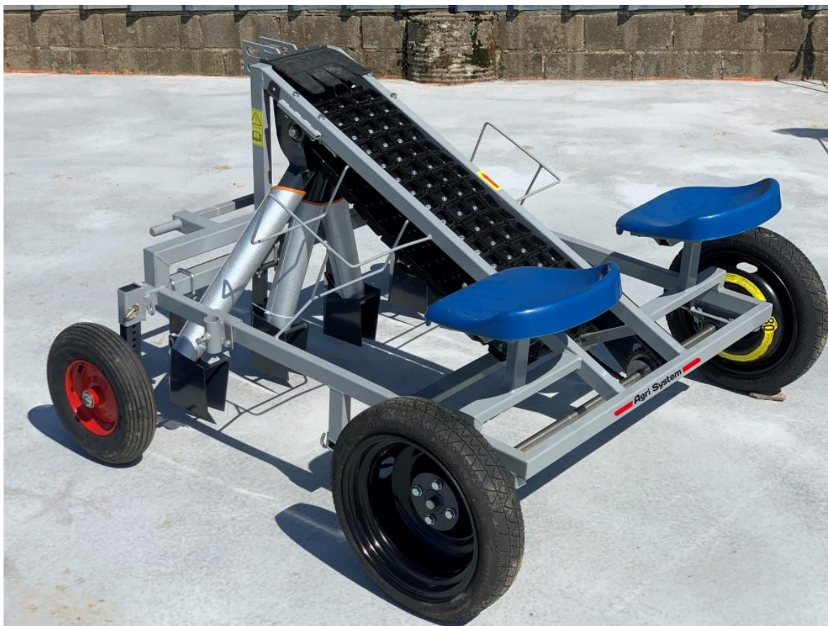
Planteuse bulbilles à courroie 4 rangs