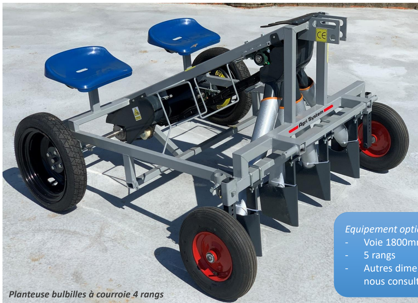
Planteuse bulbilles à courroie 4 rangs