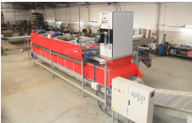
Instalación de un equipo en un proceso de secado poscosecha. Installation of a MM machine in a post-harvest drying process. Installation d'une équipe MM dans processus de séchage après récolte.