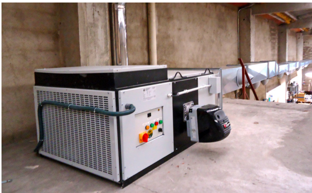
Instalación de un equipo MM-H en una nave industrial. Installation of a MM-H machine in a industrial area. Installation d'une équipe MM-H dans une engin industrielle

Installation example / Exemple de montage