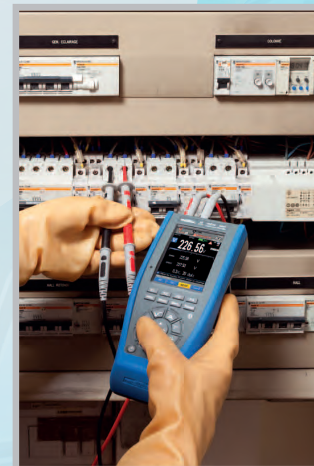
Mesures sur armoires électriques