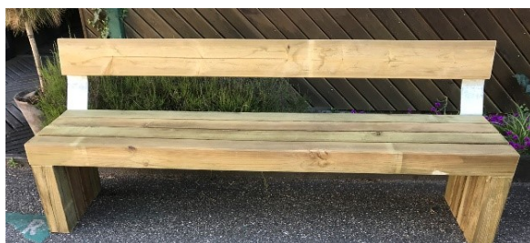
BMQA + BMQAD (Banc)