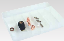
Coffret consommables pour Torche TPT 40 45 A - 039957