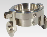
Chariot pour Torche TPT 40 040199