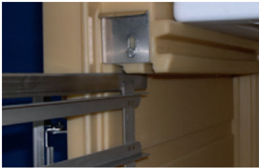
Introduction du rack en format euronorme

1 seul jeu de rack 6 niveaux (120 litres) ou 10 niveaux (200 litres) pour passer du format GN 1/1 au format euronorme en moins de 30 secondes