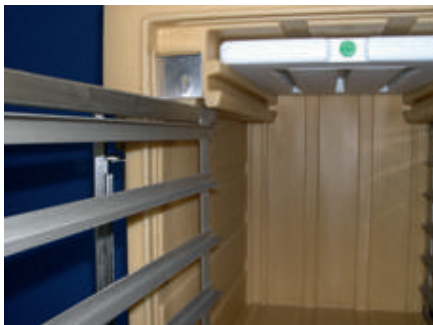
Introduction du rack en format GN