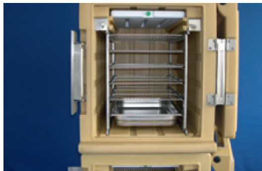
Principe de superposition de 2 armoires