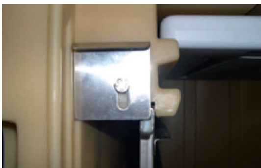
Blocage du rack