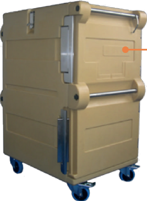
Armoires 200 L