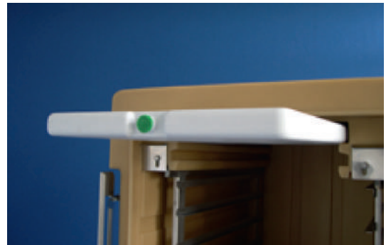
Plaque eutectique - 3°C ou - 21°C