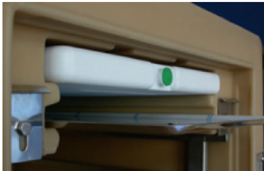
Plaque de récupération