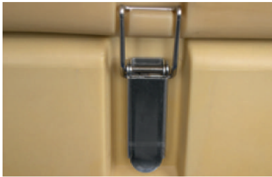
Attache de liaison pour maintenir ensemble 2 armoires superposées