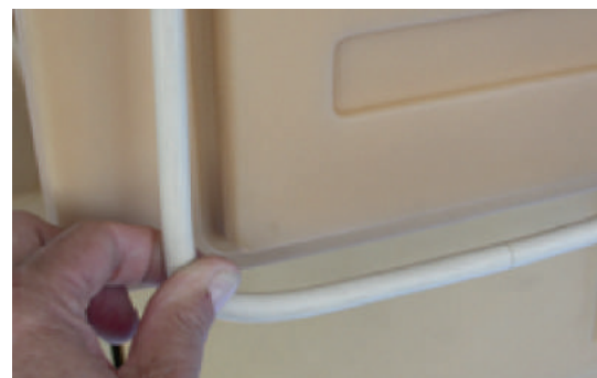
Joint de porte démonté et monté en moins de 10 secondes