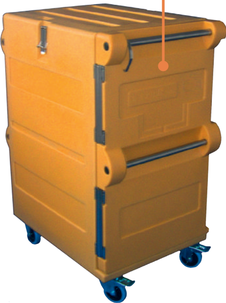
Armoires 320 L