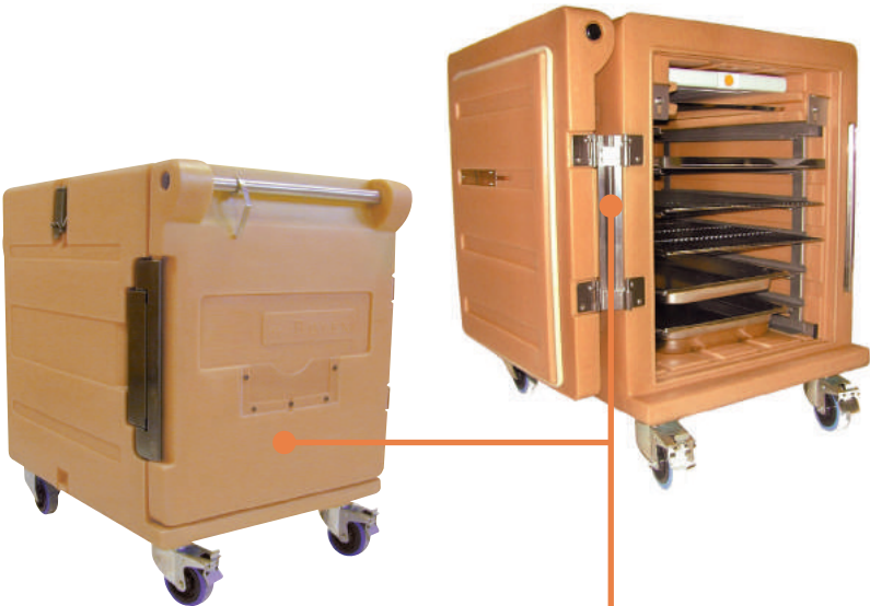
Armoires 120 L