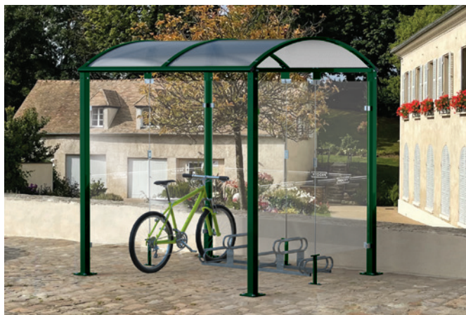
Réf. 529022 + 204719