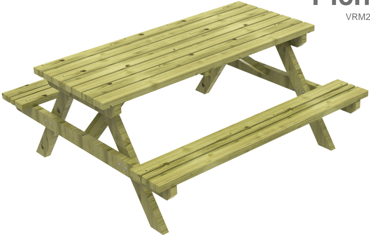
Table en bois de pin avec traitement autoclave vide et pression classe IV contre les vrillettes, termites et insectes. Lattes de 1750 x 95 x 45mm. Note : Le bois naturel "respire", c'est-à-dire qu'il absorbe et restitue de l'humidité dans une atmosphère sèche. Il est par conséquent normal que des fissures apparaissent dans le bois. Cela n'influence en rien sa capacité de résistance et sa durabilité.